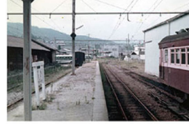
▲ 廃線決定後の駄知駅

駄知町内には昭和47年まで土岐市駅と駄知を結ぶ鉄道があり、現在は整備され遊歩道となっています。沿線には駄知の歴史を物語る建物もいっぱい! ぶら散歩には最適です。