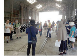
▲ 現在の様子。 バス車庫内には、今もレールが残っています。